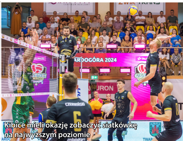
Kibice mieli okazję zobaczyć siatkówkę na najwyższym poziomie

W hali Gminnego Ośrodka Sportu i Rekreacji odbyła się męska i żeńska edycja międzynarodowego turnieju.