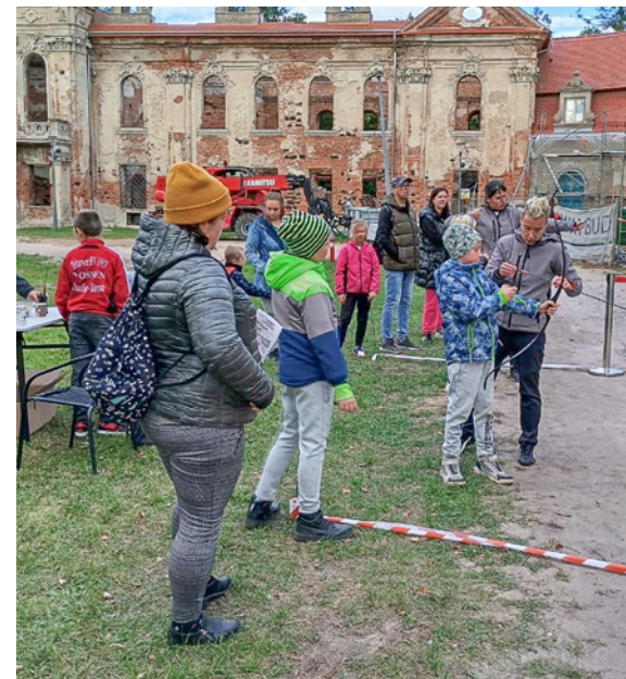
Zawody dla dzieci i młodzieży zorganizowała Młodzieżowa Rada Gminy Twardogóra

Blisko 60 osób wzięło udział w zawodach łuczniczych, które odbyły się 29 września w Goszczu. Na uczestników wydarzenia czekały dodatkowe konkurencje sportowe oraz nagrody. Organizatorem zawodów była Młodzieżowa Rada Gminy Twardogóra we współpracy z Biblioteką Publiczną Miasta i Gminy im. Wł. St. Reymonta w Twardogórze. W organizację wydarzenia włączyła się również grupa wolontariuszy z SP 2 w Twardogórze, a nad przebiegiem zawodów czuwała Dobroszycka Grupa Strzelecka – Fundacja.