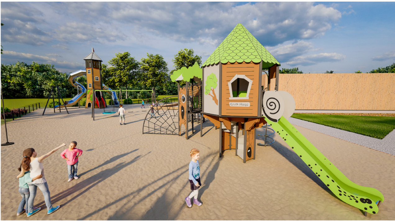
Plac zabaw przy nowym przedszkolu będzie dostępny dla wszystkich młodych mieszkańców gminy

Trwa drugi etap budowy nowego przedszkola przy ul. Poznańskiej w Twardogórze. Realizowane obecnie prace są kontynuacją inwestycji zakończonej w czerwcu 2024 r., której przedmiotem była budowa 6 oddziałów przedszkolnych wraz z częścią administracyjną, techniczno-gospodarczą i żywieniową oraz częściowym zagospodarowaniem terenu. II etap obejmuje kompleksową budowę 5 oddziałów przedszkolnych oraz 1 oddziału żłobka, instalacje wewnętrzne: sanitarną, p-poż., wodociągową, deszczową, podlewania zieleni, wentylację mechaniczną, grzewczą, ogrzewanie podłogowe oraz przebudowę istniejącej instalacji deszczowej, a także instalacje elektryczne w tym: teletechniczne, CCTV, instalacje paneli fotowoltaicznych; wyposażenie i aranżację pomieszczeń całości obiektu dla I etapu (z wyjątkiem kuchni) i dla