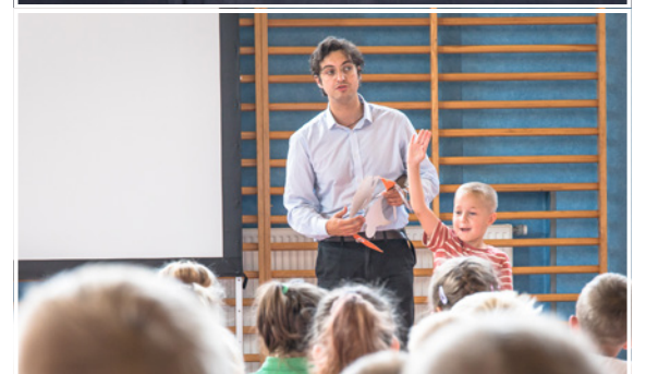
Codziennie osłuchiwanie się z językiem obcym ułatwi jego przyswajanie