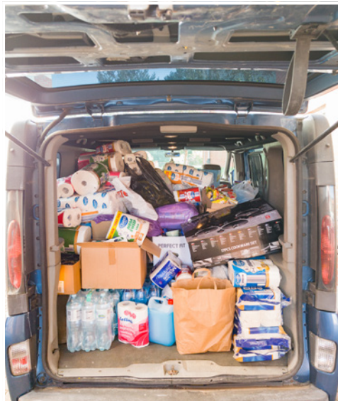
Zebrań dary, gotowe do transportu

W kilku rejonach województw: dolnośląskiego, opolskiego i śląskiego ogłoszono we wrześniu stan klęski żywiołowej. Walka ze skutkami powodzi trwała m.in. w gminie Bystrzyca Kłodzka i Głuchołazach dokąd trafiły zebrane w naszej gminie dary. Mieszkańcy przekazali potrzebującym wodę, środki higieniczne, środki czystości, żywność, nowe koce, ręczniki a także łopaty, wiadra i osuszacze. Zbiórki zorganizowane przez Gminę Twardogóra odbyły się w Gminnym Ośrodku Sportu i Rekreacji w Twardogórze, SP w Grabownie Wielkim i SP w Goszczu. W pomoc powodzianom włączyli się również: Stowarzyszenie Rowerkowo w Dolinie Baryczy, Parafia MB Wspomożenia Wiernych w Twardogórze, ZSP w Twardogórze, Restauracja INTRO, GKS Lotnik Twardogóra oraz OSP w Twardogórze. Nasi mieszkańcy pomagali osobom potrzebującym usuwać skutki powodzi w Gorzanowie (gmina Bystrzyca Kłodzka), a strażacy umacniali wały przeciwpowodziowe w Gminie Kotla.