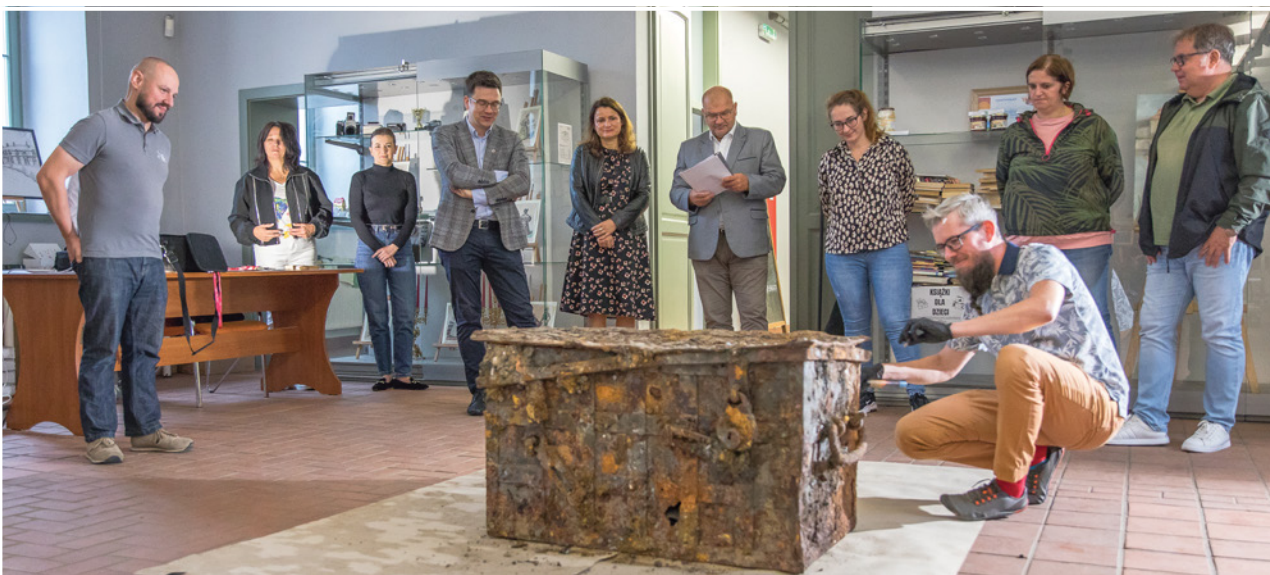
W oczekiwaniu na moment otwarcia skrzyni

fragmenty papieru z zapisami nutowymi, tekstem drukowanym i pisanym oraz pieczęcią. W środku znalazły się także fragmenty szkła, ceramiki oraz elementy metalowe, które mogły być częścią samej skrzyni. Zostaną one teraz poddane konserwacji i dalszej analizie. Uszkodzone mechanizmy zabezpieczające wskazują, że skrzynia mogła zostać naruszona jeszcze przed pożarem, który wybuchł w pałacu w 1947 roku.