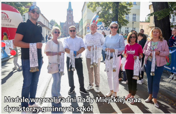
Medale wręczali radni Rady Miejskiej oraz dyrektorzy gminnych szkół