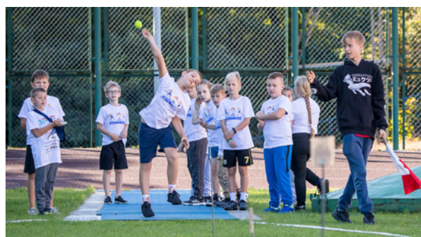
Młodzi lekkoatleci mogą rozwijać pasję w MLKS "ECHO"

Na twardogórskim stadionie lekkoatletycznym odbyły się zawody dla uczniów klas 1-3 w ramach programu "Lekkoatletyka dla Każdego", promującego aktywność fizyczną i rozwój sportowy dzieci. Młodzi zawodnicy rywalizowali w biegach, skokach i rzucie piłeczką, prezentując zaangażowanie i ducha sportowego. Wszyscy otrzymali pamiątkowe koszulki. Program umożliwia dzieciom rozwój sportowy niezależnie od poziomu, stawiając na radość z aktywności. Zajęcia prowadzi Szkoła Podstawowa nr 2 w Twardogórze w poniedziałki, środy, piątki oraz we wtorki i czwartki.