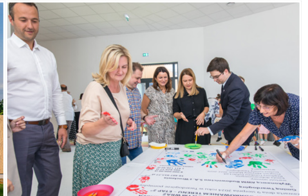
Uroczyste podpisanie umowy z wykonawcą

II etapu, w tym: aranżację wystroju pomieszczeń, wymalowanie i wyklejenie oznaczeń, umeblowanie pomieszczeń dydaktycznych, szatniowych, administracyjnych, gabinetów, pomieszczeń socjalnych, sanitarnych i gospodarczych; zagospodarowanie terenu, miejsca parkingowe i chodniki, małą architekturę, ogrodzenia, urządzenie i wyposażenie placów zabaw, urządzenie zieleni i stref rekreacji, remont nawierzchni jezdni ul. Kopernika. Wykonawcą zadania jest firma AWM Budownictwo S.A. z Wrocławia – za kwotę 10 407 957,77 zł. Gmina Twardogóra pozyskała dofinansowanie w wysokości: 8 000 000,00 zł - w ramach Rządowego Funduszu Polski Ład: Program Inwestycji Strategicznych, 986 829,37 zł – z Programu Aktywny Maluch 2022-2029. Pozostałe środki, tj. 1 421 128,40 zł - pochodzą z budżetu Gminy Twardogóra.