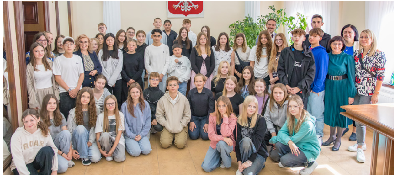
Młodzież z Polski i Niemiec w twardogórskim Ratuszu