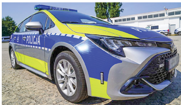
Nowoczesny radiowóz wspiera działania funkcjonariuszy na terenie gminy