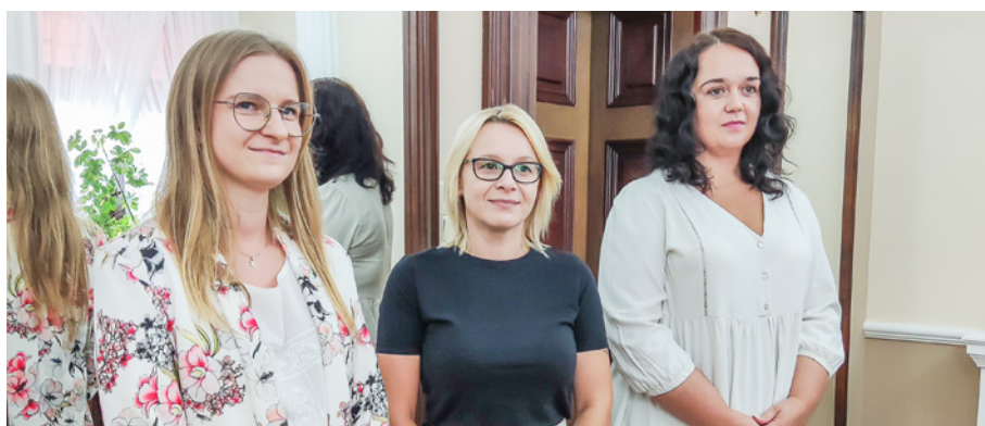
Panie złożyły ślubowanie i odebrały akty mianowania