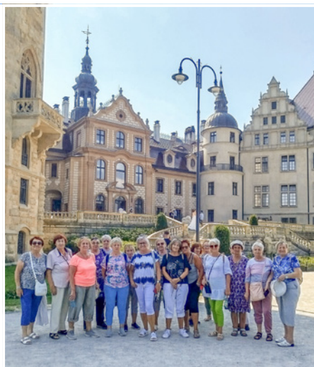
Wycieczki to jedna z form aktywności, z której korzystają seniorzy