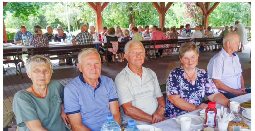
Spotkanie w Chelstowie, to już tradycja

Jak co roku w Centrum Inicjatyw Wiejskich w Chelstowie seniorzy zrzeszeni w Oddziale Rejonowym Polskiego Związku Emerytów, Rentistów i Inwalidów w Twardogórze spotkali się by świętować Dzień Inwalidy i Osób Niepełnosprawnych. Prezydium PZERIiI przygotowało dla uczestników wydarzenia poczęstunek, połączony z zabawą taneczną oraz wspólnym śpiewem z orkiestrą. Nasi mieszkańcy mieli okazję do spotkania, wspólnej rozmowy i wymiany poglądów.