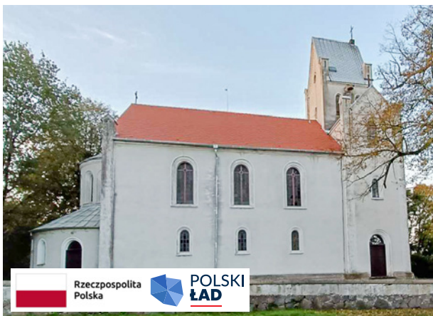
Wymiana pokrycia dachu była niezbędna do skutecznego zabezpieczenia kościoła w Grabowni W.