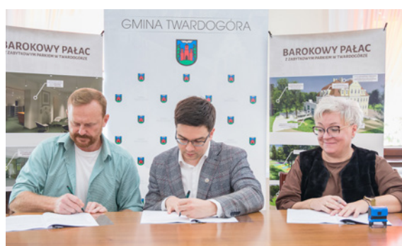
Wykonawca zrealizuje zadanie w terminie 200 dni

27 września została podpisana umowa na rozbiorę skrzydeł pałacu barokowego w Twardogórze. Skrzydła zostały dobudowane do zabytku w latach 60 XX w., a ich wyburzenie jest niezbędne do podjęcia dalszych prac związanych z przebudową pałacu i zmianą sposobu użytkowania. Jest to także symboliczny początek prac rewitalizacyjnych. Zadanie za kwotę 150 000 zł wykona firma WELES Jacek Kłosiński z Wrocławia. Gmina Twardogóra pozyskała dofinansowanie na ten cel w kwocie 147 000 zł z Rządowego Funduszu Polski Ład: Programu Inwestycji Strategicznych.