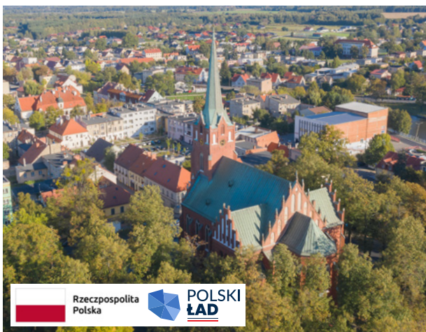
Etap IV remontu Bazyliki Mniejszej dotyczyć będzie elewacji tylnej – strony wschodniej.

Gmina Twardogóra pozyskała dofinansowanie na remont dachu kościoła w Grabowni Wielkim oraz elewacji tylnej Bazyliki Mniejszej. Środki z Rządowego Programu Ochrony Zabytków zostały przekazane w formie dotacji parafiom zarządzającym zabytkami. W Grabowni Wielkim wymieniono pokrycie dachu wraz z obróbkami blacharskimi w celu skutecznego zabezpieczenia budowli przed opadami atmosferycznymi. Dach pokryto dachówką ceramiczną. Całkowity koszt realizacji zadania to 149 989,02 zł, z czego 146 989,24 zł stanowi dotacja, a 2%, wymagany wkład własny parafii. W Twardogórze prace polegają będą na odtworzeniu stanu pierwotnego zabytku w zakresie elewacji kościoła z niezbędnymi przemurzeniami, impregnacją wszystkich jej elementów, wymianą spoin w murach i obróbkami blacharskimi, a także z regulowaniem i odprowadzeniem wód opadowych. Koszt zadania wyniesie 546 312,00 zł, pozyskane środki to 200 000 zł.