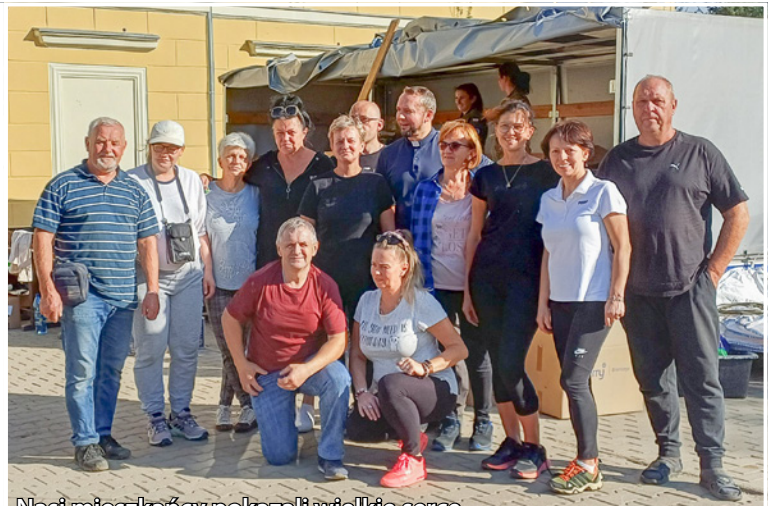
Nasi mieszkańcy pokazali wielkie serce