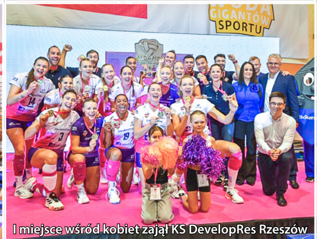
I miejsce wśród kobiet zajął KS DevelopRes Rzeszów