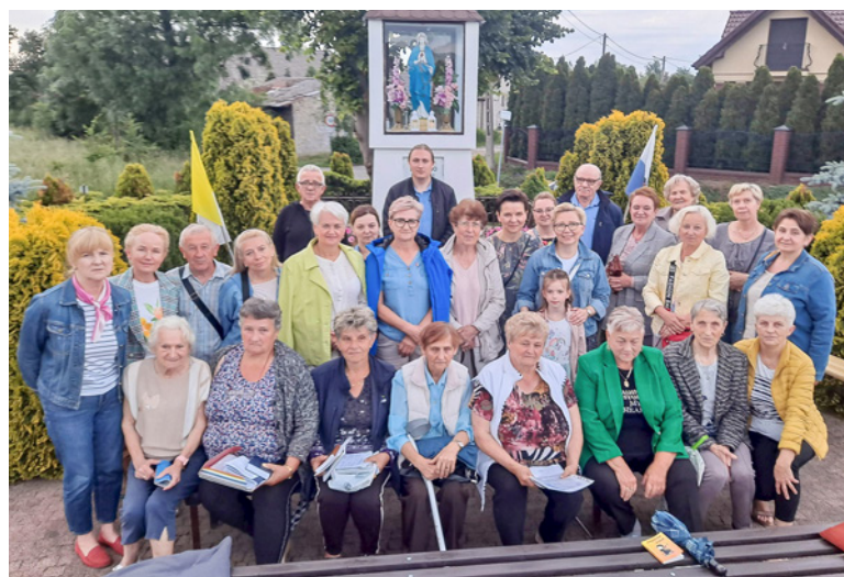
Przydrożne kapliczki to symbol wiary i tradycji

szych ojców oraz nasz narodowy skarb i duma. W naszej gminie jest wiele takich miejsc, a 48 z nich zostało opisanych w publikacji pt. „Przydrożne krzyże i kapliczki” wydanej w roku 2010 przez Stowarzyszenie Jana Pawła II w Twardogórze. Podczas tegorocznych majowych i czerwcowych wycieczek członkowie chóru Rapsodia spotkali się z mieszkańcami Drągowa, Łazisk, Nowej Wsi Goszczańskiej i Sądrążyc. Odwiedzili miejsca, które upamiętniają zapis historii i wydarzeń związanych z małą architekturą sakralną na terenie naszej gminy. Mieszkańcy dbają i otaczają stałą opieką przydrożne kapliczki i krzyże z szacunku dla tych, którzy je ufundowali i jako dziedzictwo dla przyszłych pokoleń. Zadanie publiczne w zakresie działalności wspomagającej rozwój wspólnot i społeczności lokalnych sfinansowała Gmina Twardogóra.