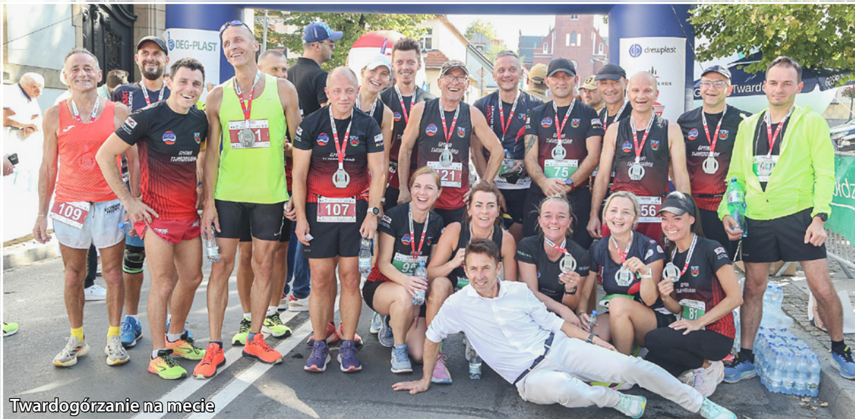
Twardogórzanie na mecie