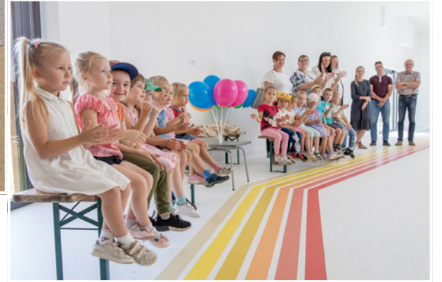
Uczestnikami wydarzenia były również przedszkolaki