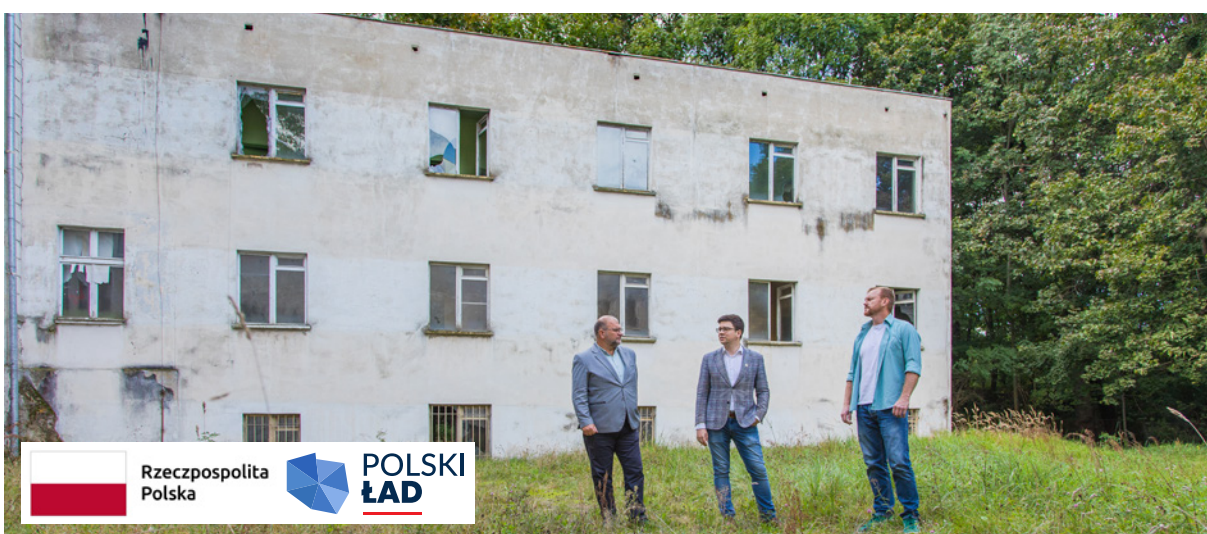
Przyszłość twardogórskiego pałacu była konsultowana z mieszkańcami