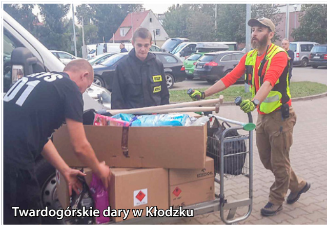
Twardogórskie dary w Kłodzku