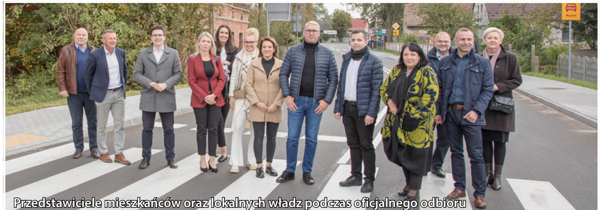
Przedstawiciele mieszkańców oraz lokalnych władz podczas oficjalnego odbioru