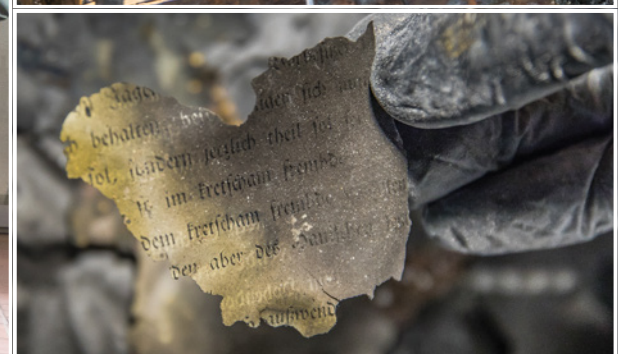
Fragmenty dokumentów zostaną poddane konserwacji i dalszej analizie