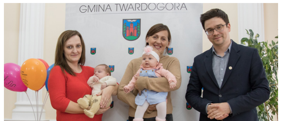
Wyprawka dla twardogórskiego malucha funkcjonuje od 2023 roku

niezależnie od dochodów. Wnioski o przyznanie wyprawki można składać w Urzędzie Miasta i Gminy w Twardogórze - w terminie trzech miesięcy od narodzin dziecka. W skład wyprawki wchodzi: body, chusta, krążek z graverem, drewniana girlanda, pieluszki bawełniane, kocyk z personalizowaną metką, karty sensoryczne oraz pudełko z nadrukiem. Więcej informacji o wyprawce można znaleźć w zakładce Mieszkaniec na stronie twardogora.pl.