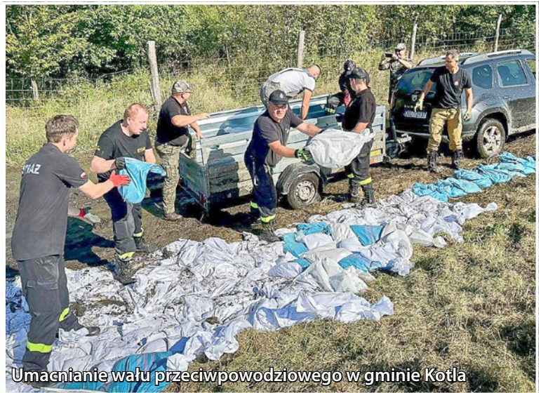
Umocnianie wału przeciwpowodziowego w gminie Kotla