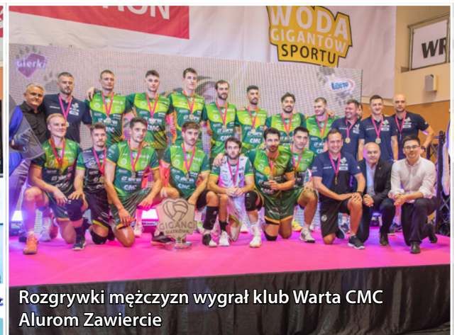
Rozgrywki mężczyzn wygrał klub Warta CMC Alurom Zawiercie