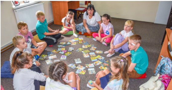
Podczas zajęć dzieci brały udział w kreatywnych grach i zabawach edukacyjnych

W sierpniu twardogórska biblioteka gościła młodych czytelników podczas warsztatów "Podróże małe i duże". Uczestnicy mieli okazję nie tylko zapoznać się z bogatą ofertą wakacyjnej literatury dziecięcej, ale także rozwijać swoją kreatywność. Podczas warsztatów fotograficznych dzieci mogły odkrywać piękno otaczającej nas przyrody. Chłopak, gazetowa wojna, czy tor przeszkód namalowany kredą, to tylko niektóre z atrakcji, które zapewniły dzieciom mnóstwo radości. Swoją wiedzę i pasję podzielili się również pracownicy Nadleśnictwa Oleśnica Śląska.