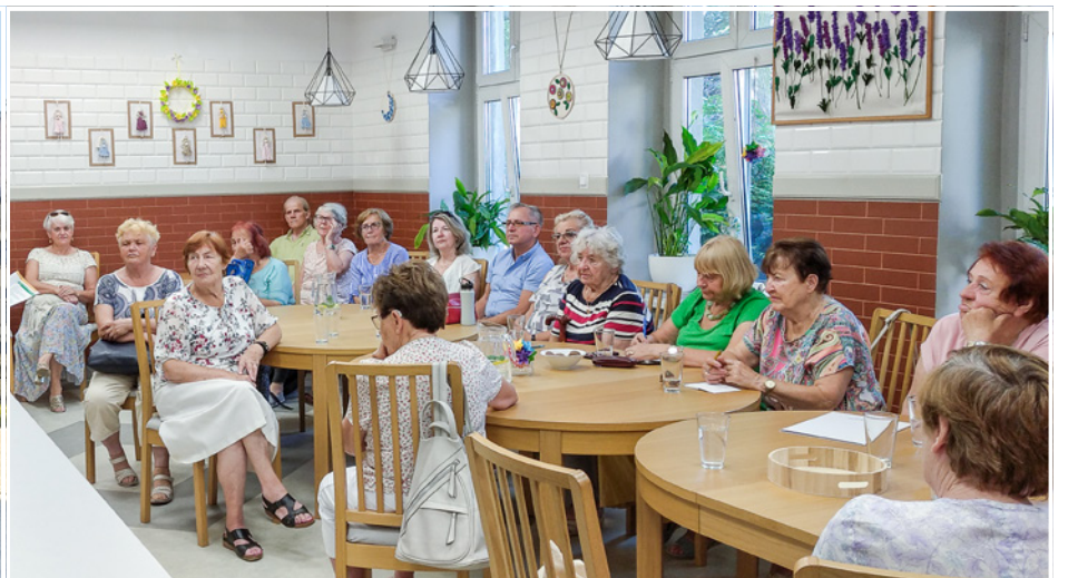
W Klubie Senior + odbywają się cykliczne spotkania