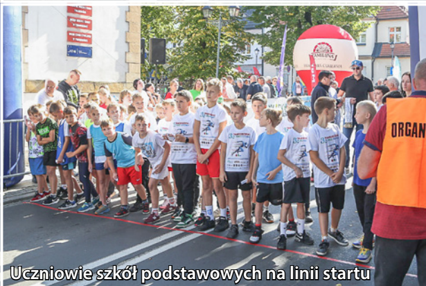
Uczniowie szkół podstawowych na linii startu