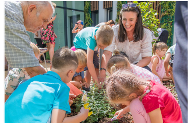
W atrium posadzono budleje, czyli motyle krzewy