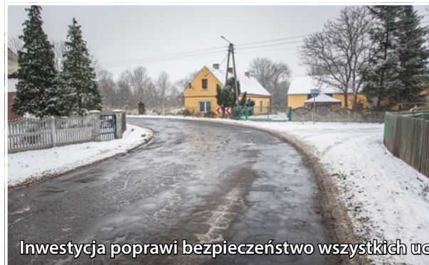
Inwestycja poprawi bezpieczeństwo wszystkich uczestników ruchu drogowego