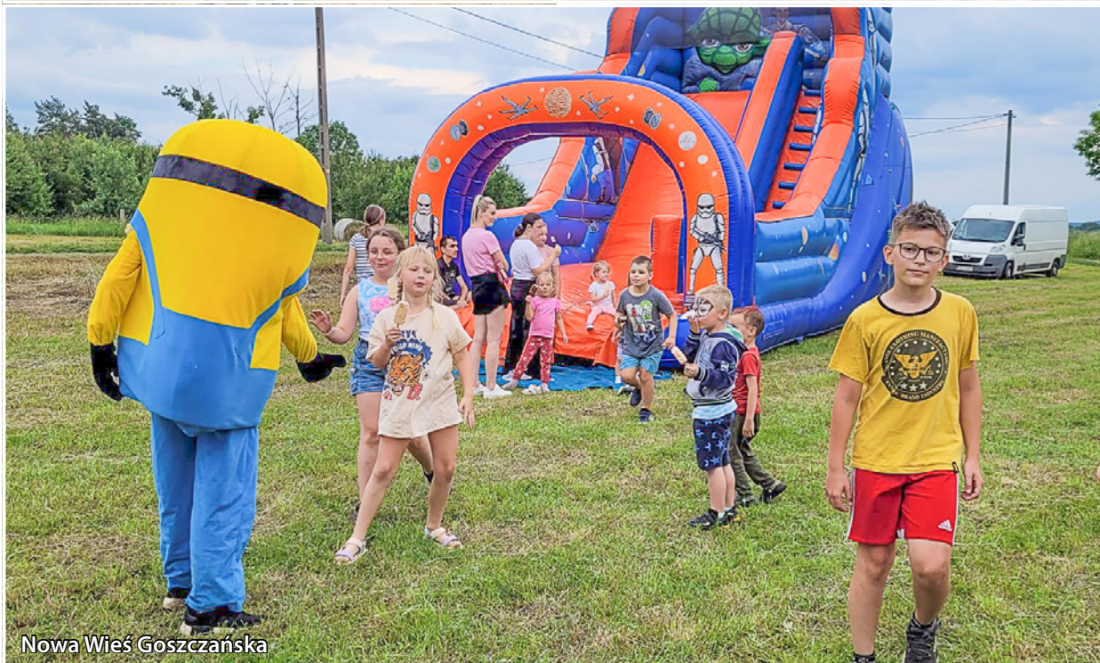
Nowa Wieś Goszczańska