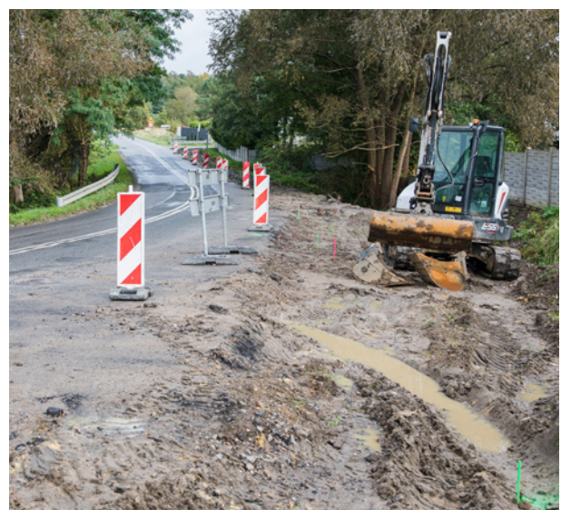
Mieszkańcy czekali na chodnik wiele lat

Rozpoczęła się budowa chodnika przy głównym skrzyżowaniu w Chełstówku. Chodnik, który powstaje w odpowiedzi na wnioski mieszkańców, zwiększy bezpieczeństwo mieszkańców sołectwa. Realizacja zadania przy drodze wojewódzkiej jest możliwa dzięki środkom z budżetu Województwa Dolnośląskiego, dofinansowaniu z Rządowego Funduszu Rozwoju Dróg oraz środkom z budżetu Gminy Twardogóra (25% całej inwestycji).