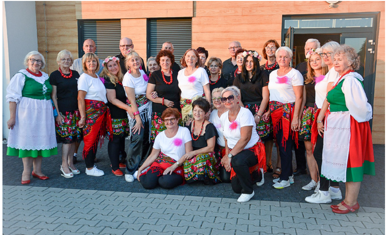
Zespół Skorynianie zaprezentował się na spotkaniu kół gospodyń wiejskich, promując lokalne tradycje i kulturę

odbyło się w Bukowinie Sycowskiej. Spotkanie było okazją do nawiązania nowych znajomości, wymiany doświadczeń, propagowania pasji do tradycji i kultury wiejskiej oraz czerpania inspiracji do dalszych działań.