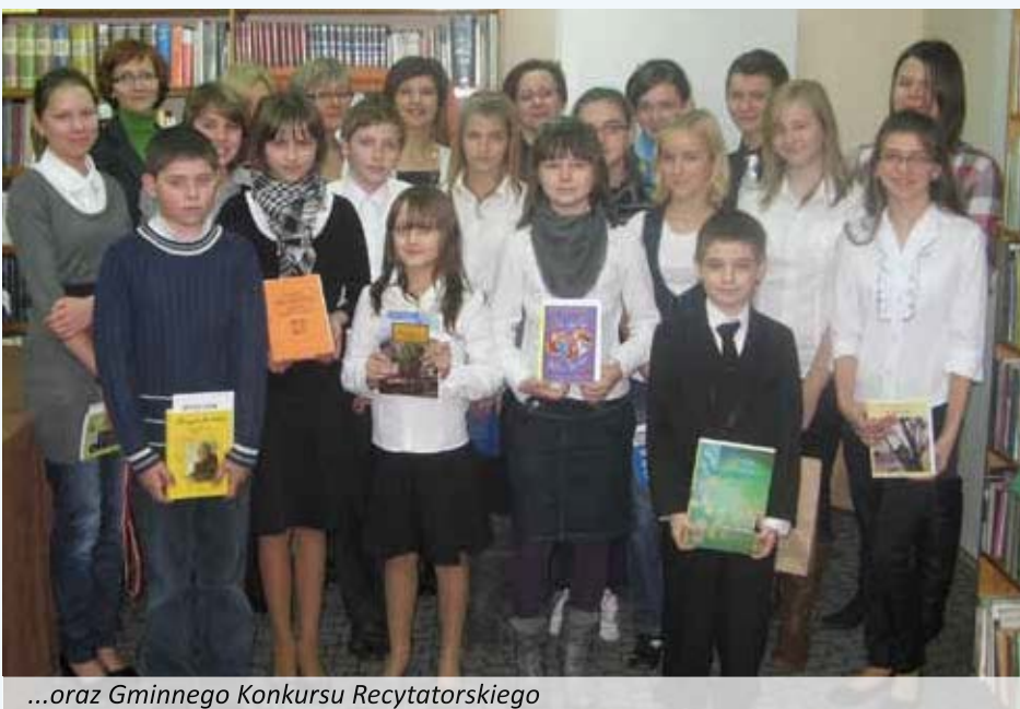
...oraz Gminnego Konkursu Recytatorskiego