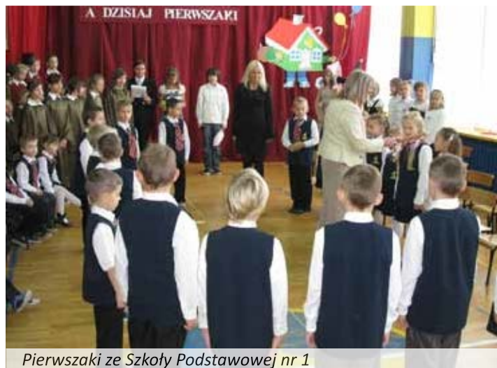
Pierwszaki ze Szkoły Podstawowej nr 1

w Szkole Podstawowej nr 1. Dzieci - żółtodzioby, poprowadzone przez dobrą wróżkę przez różne krainy, udowodniły, że są gotowe, by stać w szeregach uczniów. Po ślubowaniu i pasowaniu przez dyrektorkę Marię Lidię Gerus otrzymały upominki od szóstoklasistów i wielki tort z logo szkoły od dyrektorki.