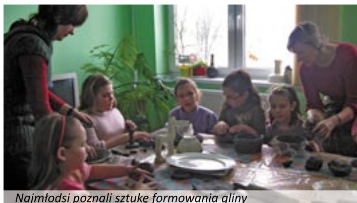
Najmłodszy poznali sztukę formowania gliny