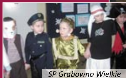
SP Grabowo Wielkie

bawili się rycerze, czarownice, królowny, piraci, muskietierowie i inne bajkowe postacie. W przerwach tancerze delectowali się przygotowanymi przez rodziców łakociami.