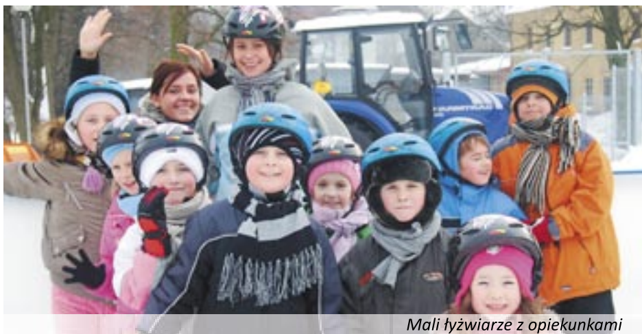
Mali łyżwiarze z opiekunkami