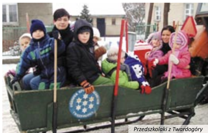
Przedzkolaki z Twardogóry

tarli szlak kuligu oraz przygotowali wspaniałe ognisko. Po tych śnieżnych wycieczkach, trochę zmarznięci, obasypani śniegiem, ogrzali się przy ognisku, pijąc gorącą herbatę i jedząc pieczone kiełbaski przygotowane przez mamy maluchów. Wszyscy się przekonali, że zima jest piękna, a wspólne zabawy integrują nie tylko dzieci, ale i rodziców.