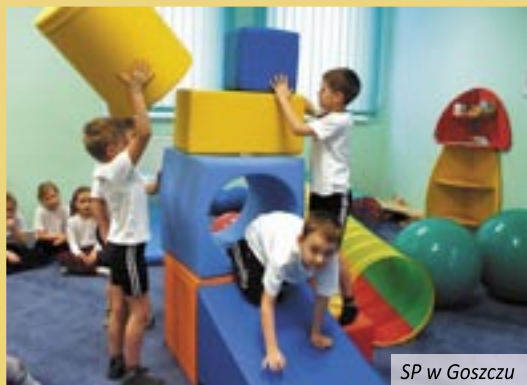
SP w Goszczu

wpływające pozytywnie na kształtowanie psychomotoryki, pamięci, charakteru i umiejętności społecznych. Pomieszczenie zostało też wyposażone w drabinki (na ścianie) oraz w suchy basen z piłeczkami. Miejsca takie posiadają także SP 1 i SP 2 w Twardogórze oraz SP w Goszczu. Szkoły utworzyły miejsca zabaw dzięki środkom finansowym pozyskanym przez gminę w wysokości 42 tys. zł z rządowego programu „Radosna szkoła”.