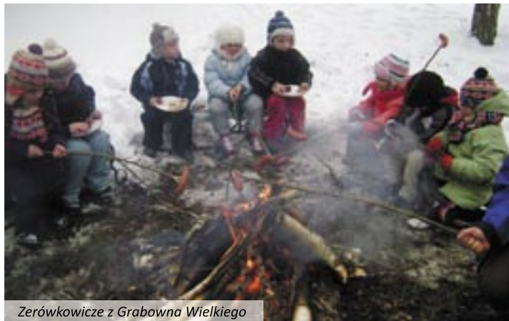
Zerótkowicze z Grabowna Wielkiego

Dzieci uwielbiają zimę i zabawy na śniegu, dlatego miały okazję wziąć udział w kuligach. Tym bardziej, że styczeń temu sprzyjał w najlepsze. 7 i 8 stycznia przejażdżki saniami zasmakowały przedszkolaki. Sanna była „pyszna”, a dla niektórych dzieci był to pierwszy kulig w życiu. Pod czujną opieką nauczycielek i pań oddziały wych, saniami zwiędziły oko-