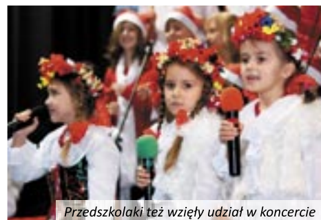
Przedszkolaki też wzięły udział w koncercie

przez Klub Młodego Odkrywcy, kącik ozdabiania balonów, malowania twarzy, kolorowych prasowanek. Otwarto też kawiarenkę, w której można było skosztować pysznych wypieków, przygotowanych przez rodziców gimnazjalistów. VII Koncert Bożonarodzeniowy uświetnił występ małych aktorów i tancerzy z Miejskiego Przedszkola w Twardogórze z Oddziałem Małego Dziecka. Popisy maluchów wzbudziły duży aplauz widzów. Równie ciepło zostali przyjęci uczniowie Społecznego