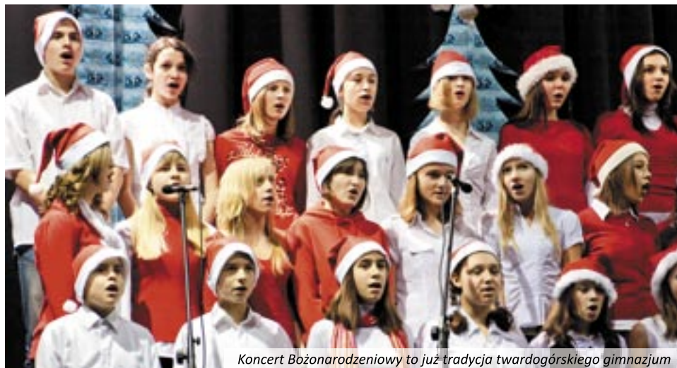
Koncert Bożonarodzeniowy to już tradycja twardogórskiego gimnazjum

Ogniska Artystycznego „Allegretto”, którzy wykonali nastrojowe: „Przeżyczymy sobie znak pokoju” oraz „Przybieżeli do Betlejem”. Kolejnym punktem programu był występ gimnazjalnego chóru, który brawurowo wykonał kilka pastorałek i świątecznych piosenek. Goście byli również pod wrażeniem tanecznych popisów gimnazjalnej młodzieży. Dziewczęta i chłopcy, przebrani za anioły i diabły, zaprezentowali odwieczną walkę dobra i zła. Duże oklaski dostali również tańczący św. Mikołajowie. Oczywiście nie mogło zabraknąć jasełek. Współczesna historia narodzenia Bożej Dzieciny rozbawiła zebranych, ale i wprowadziła w refleksyjny nastrój. Mimo zimowej aury, szczytny cel wyzwolił w dzieciach i dorosłych najcieplejsze uczucia. Przybyli goście okazali wielkie serce i hojność jeszcze większą, niż w poprzednich latach.