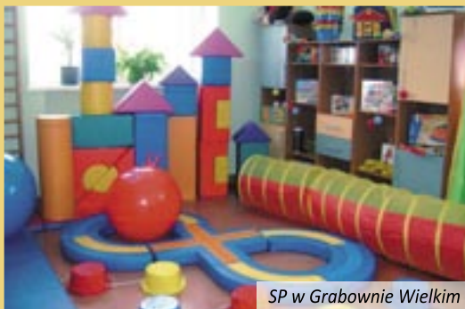
SP w Grabownie Wielkim