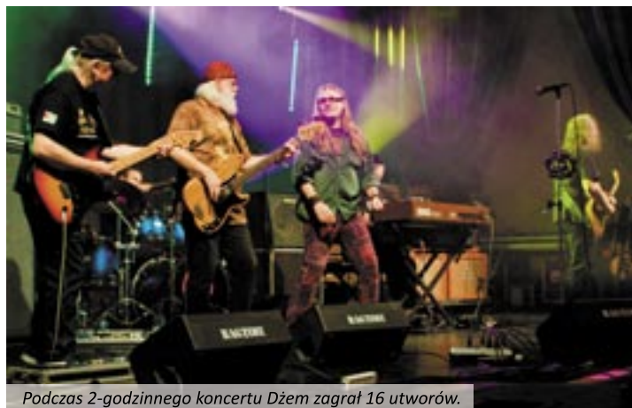
Podczas 2-godzinnego koncertu Dżem zagrał 16 utworów.

Po siedmiu latach znów przyjechali do naszego miasta i znów, jak na Dniach Twardogóry z 2002 roku, zagraли ostro i z pazurem. Ale nic w tym dziwnego, wszak „Dżem”, to jeden z najlepszych polskich zespołów, prawdziwa legenda mierzona nie tyle liczbą sprzedanych płyt, co ilością wiernych fanów, trwających przy formacji niezależnie od aktualnych mód. Było to widoczne 13 grudnia w hali sportowo-widowiskowej przy ul. Wrocławskiej, gdzie zespół oklaskiwały trzy pokolenia wielbicieli – ci grubo po pięćdziesiątce, ich dzieci, ale i kil-