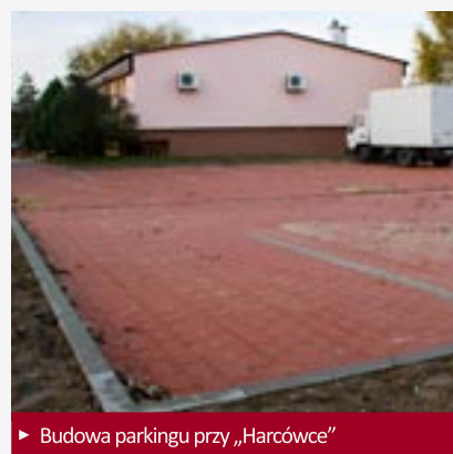
► Budowa parkingu przy „Harcówce”