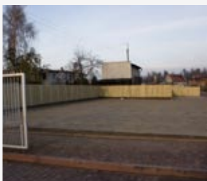
► Budowa parkingu przy hali sportowo-widowisk.