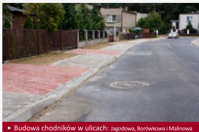
► Budowa chodników w ulicach: Jagodowa, Borówkowa i Malinowa