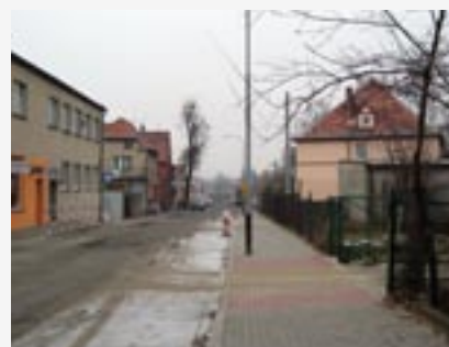
► Przebudowa ulicy Poznańskiej