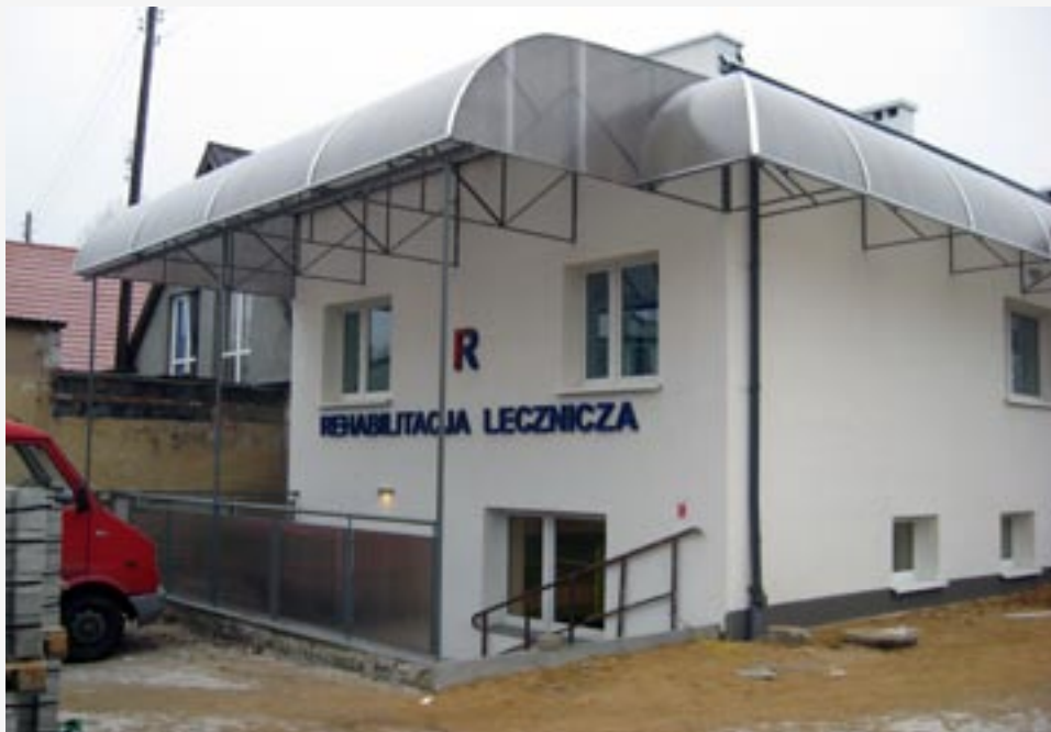
► Remont budynku usługowego przy ulicy Wielkopolskiej 11 w Twardogórze