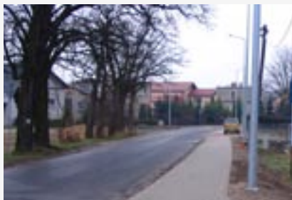
► Budowa oświetlenia drogowego w Moszycach