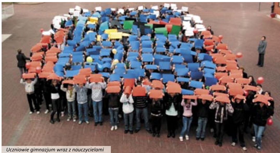
Uczniowie gimnazjum wraz z nauczycielami

26 listopada na szkolny dziedzińiec wyszli wszyscy uczniowie (blisko 500 młodych ludzi) i nauczy-