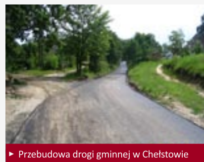
► Przebudowa drogi gminnej w Chełstowie