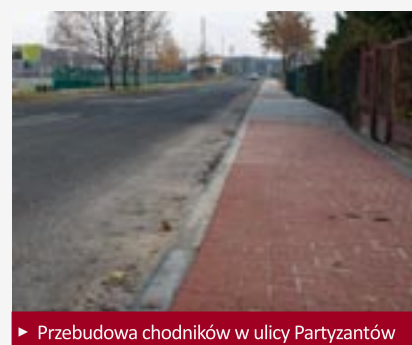
► Przebudowa chodników w ulicy Partyzantów