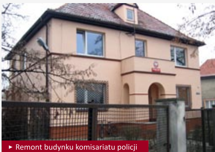
► Remont budynku komisariatu policji