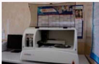
► Zakup aparatu biochemicznego do laboratorium analitycznego w SZPZOZ