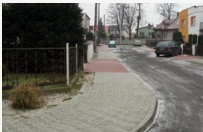
► Budowa chodników w ulicy Kazimierza Wlk., Władysława Łokietka, Bolesława Chrobrego, Władysława Warneńczyka