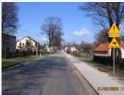
► Budowa chodników w Goszczu