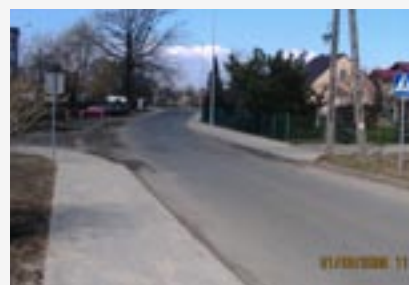
► Budowa chodników w Moszyczach