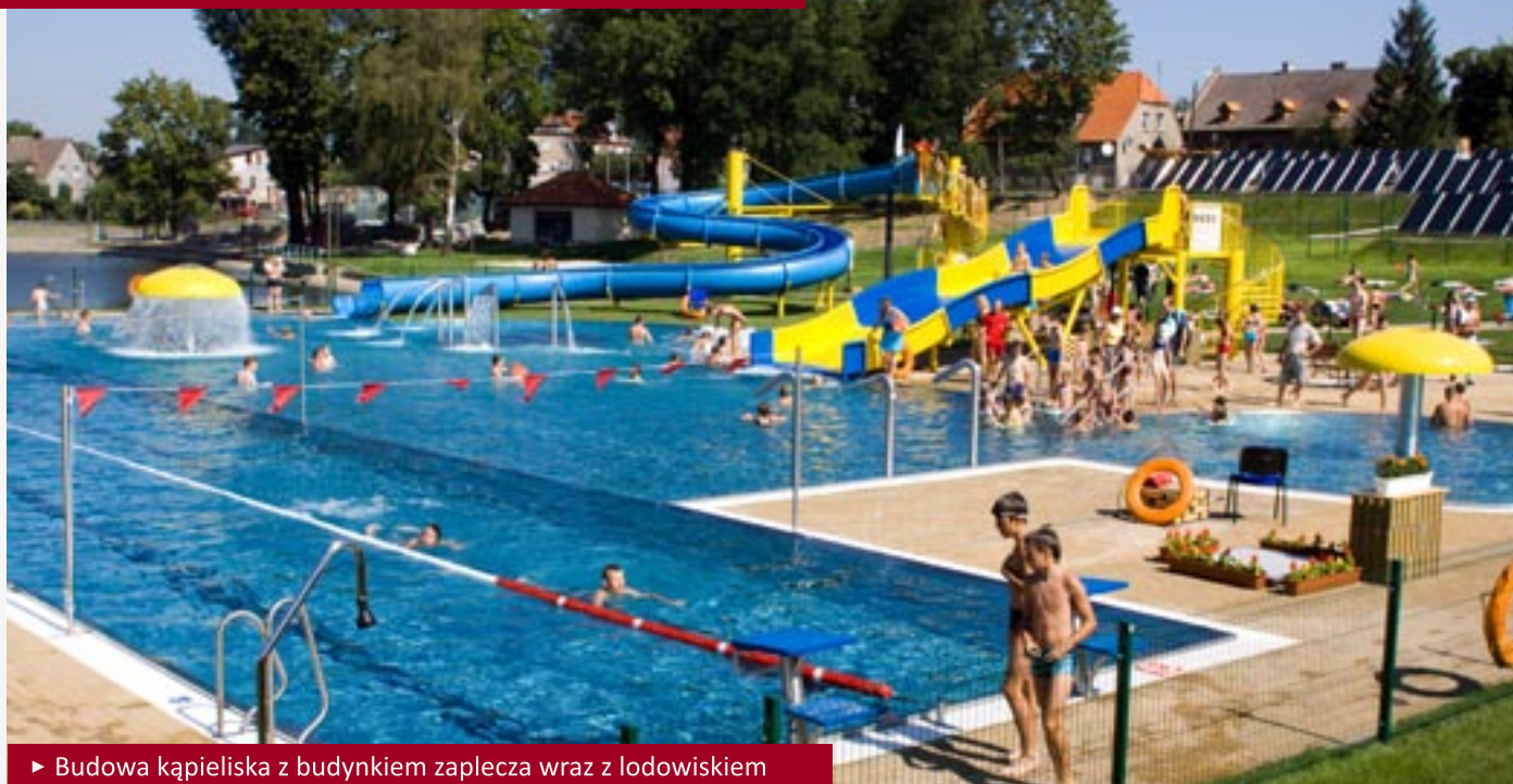
► Budowa kąpieliska z budynkiem zaplecza wraz z lodowiskiem