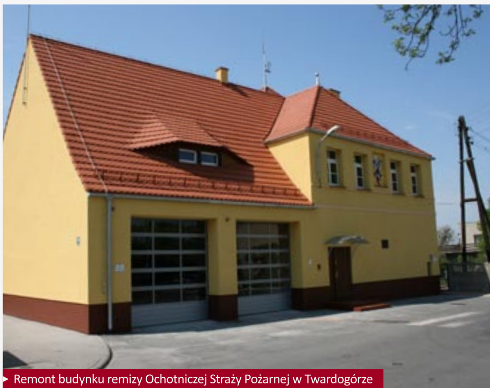
► Remont budynku remizy Ochotniczej Straży Pożarnej w Twardogórze