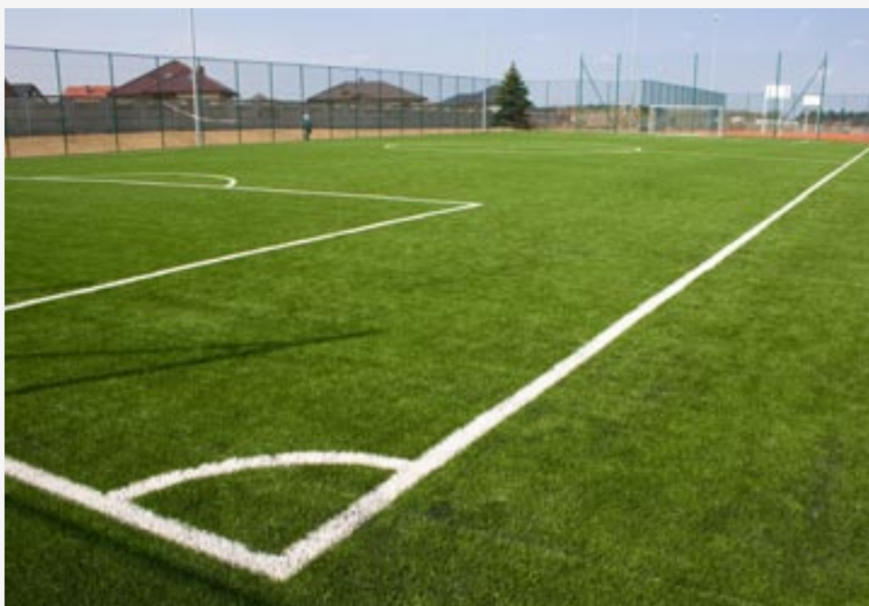
► Budowa kompleksu boisk sportowych w ramach projektu „Moje Boisko ORLIK 2012”