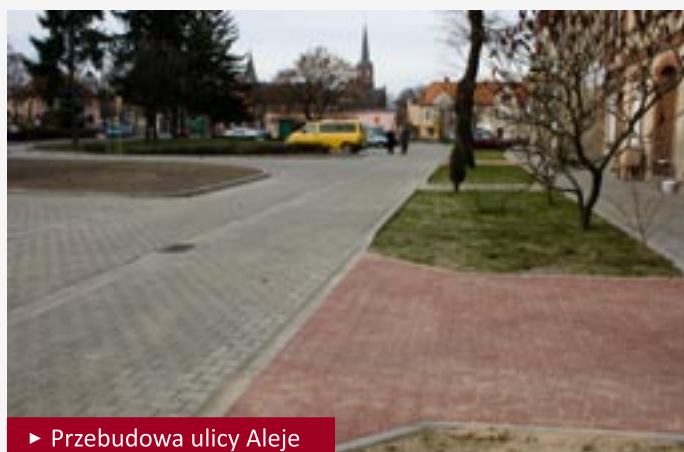
► Przebudowa ulicy Aleje