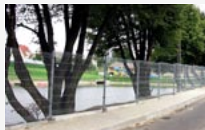
► Remont chodników i ogrodzenia wokół zbiornika rekreacyjnego i kąpieliska