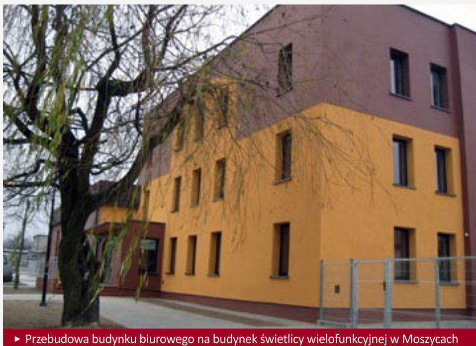
► Przebudowa budynku biurowego na budynek świetlicy wielofunkcyjnej w Moszycach