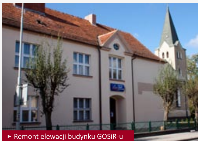
► Remont elewacji budynku GOSiR-u