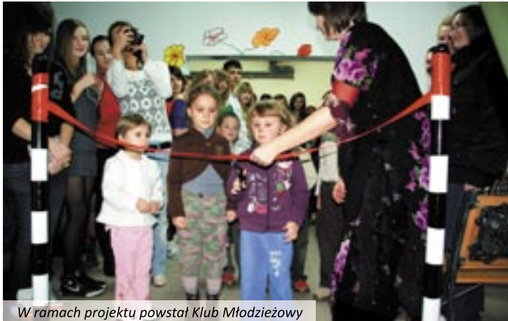
W ramach projektu powstał Klub Młodzieżowy

oży i warsztaty survivalowe, warsztaty artystyczne w Bolesławowie, wyjazdy i spotkania edukacyjne, objazdowe festyny rodzinne, marsze na orientację, zajęcia strzelnictwa sportowego, sływy kajakowe, rajdy rowerowe, występy i wystawy. Utworzono Klub Młodzieżowy „Wyskocz z