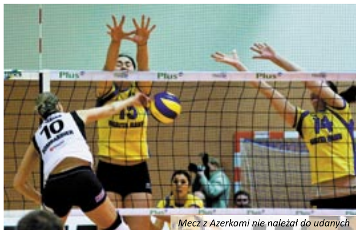
Mecz z Azerkami nie należał do udanych